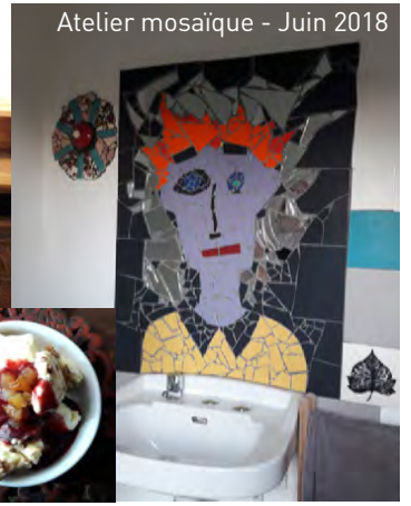
Atelier mosaïque - Juin 2018