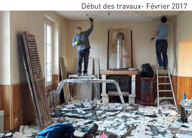
Début des travaux - Février 2017