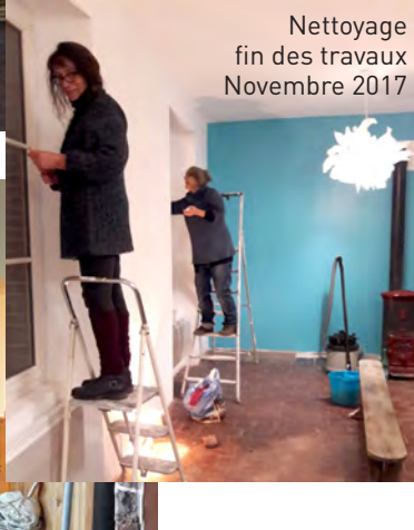
Nettoyage fin des travaux Novembre 2017