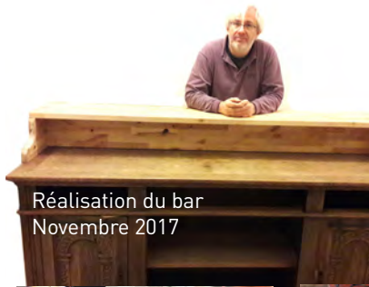
Réalisation du bar Novembre 2017