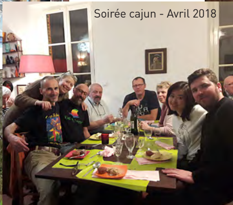
Soirée cajun - Avril 2018