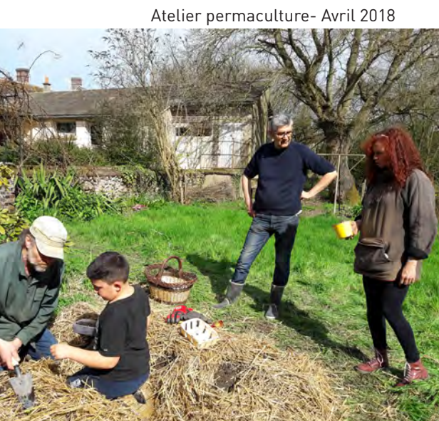
Atelier permaculture - Avril 2018