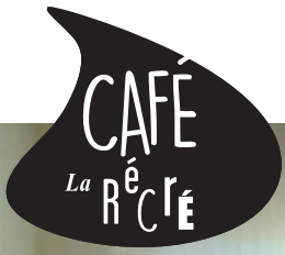
1ère visite - Janvier 2016