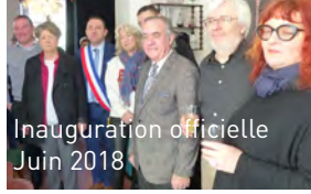
Inauguration officielle Juin 2018